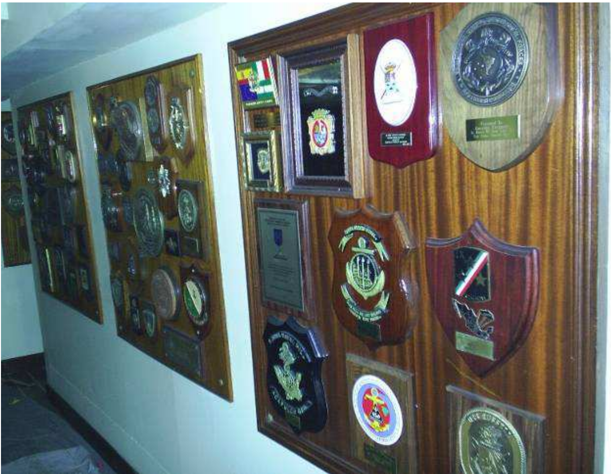
CORRIDOIO UFFICIALI dove si vedono i crest delle varie campagne e onorificenze