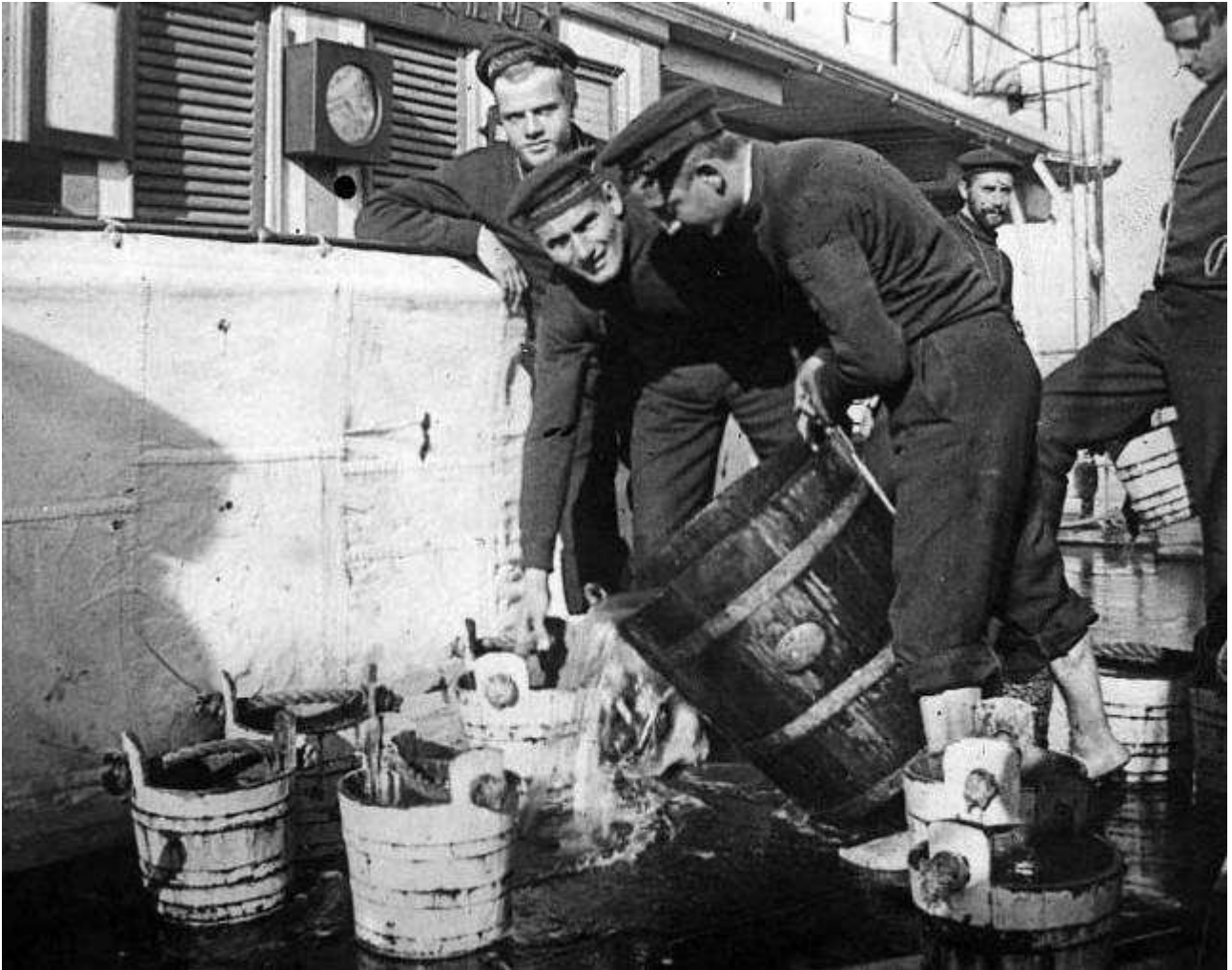
POSTO DI LAVAGGIO foto d'epoca che si commenta da sé