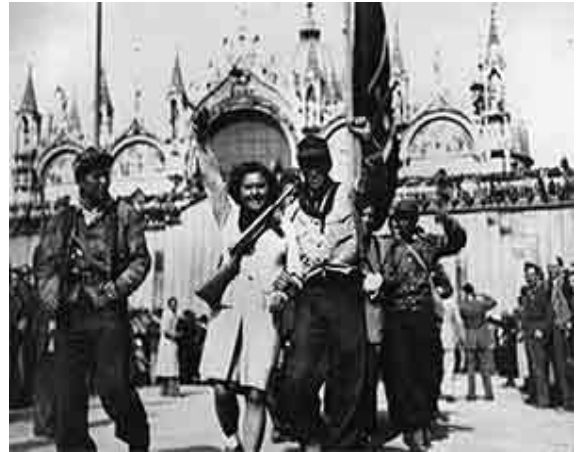
La Liberazione di Venezia

Dopo la guerra ho saputo che, all'atto dell'armistizio, si erano installati a Venezia ben diciassette sedi di comandi politico-militari tedeschi, nazisti e fascisti. Grazie all'intervento del Comitato di Liberazione Regionale Veneto-Esecutivo Militare, furono organizzate delle azioni, si verificarono scontri armati con spargimento di sangue.