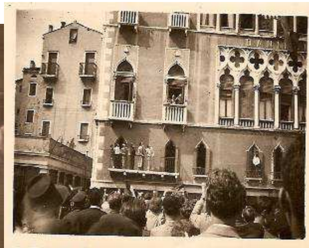
Momenti di azioni partigiane in città

Durante la mia attività di partigiano, mi trovai a partecipare all'ultimo tentativo dei tedeschi di distruggere l'arsenale; furono circondati da diversi gruppi di partigiani.