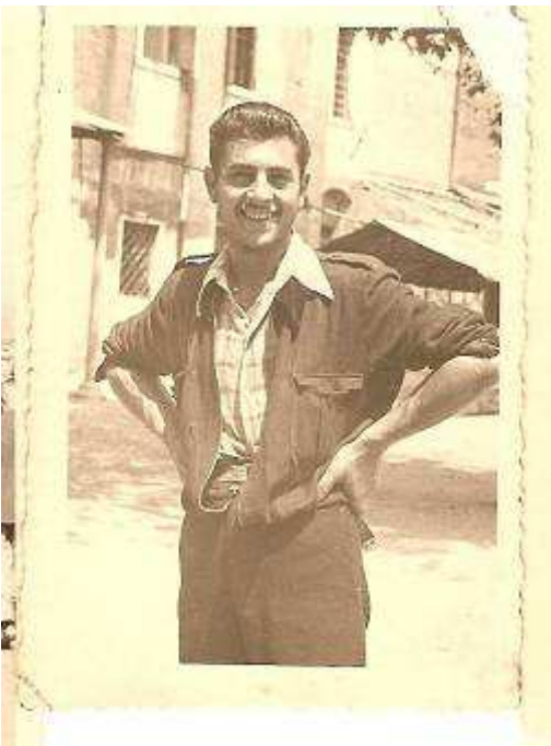
Bella vita a Venezia dopo la guerra