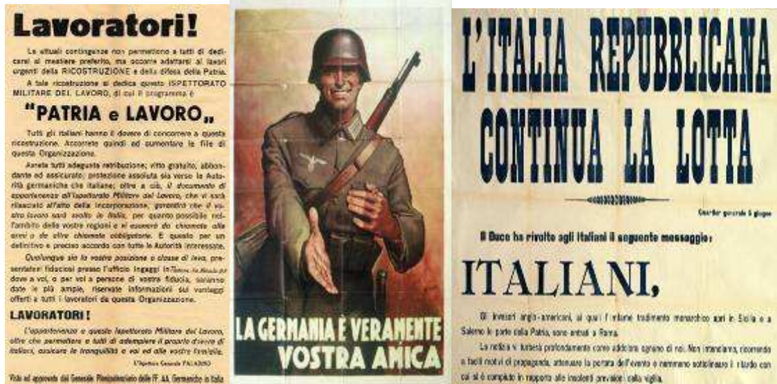
Manifesti di propaganda tedesca dopo l'Armistizio