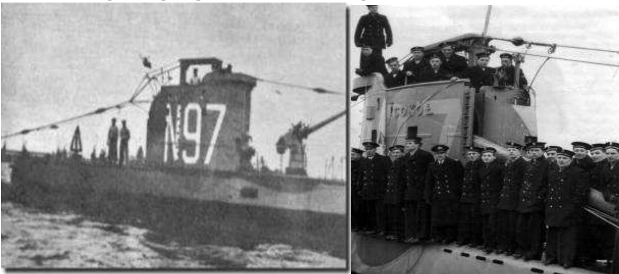
Il sommergibile polacco Sokol

Mentre la nave faceva rotta per il Sud, il pomeriggio del 13 settembre, sotto la minaccia di tre veivoli Stuka tedeschi, fu costretta a dirigersi prima a Sebenico e poi nel porto di Zara. Catturata dai tedeschi il 15 settembre che la spogliarono di ogni materiale bellico o di guerra che poteva loro servire, le fecero fare la spola tra Fiume, Pola e Venezia. A bordo, con migliaia di altri marinai e soldati, eravamo alla mercé dei tedeschi diventati, ormai, nostri acerrimi nemici. Finalmente la nave attraccò al porto di Pola, nelle acque di Veruda, ma il 7 ottobre fu silurata dal sommergibile polacco Sokol . (4) Affondata, la nave portò in fondo al mare centinaia di persone, principalmente soldati che non sapevano nuotare.