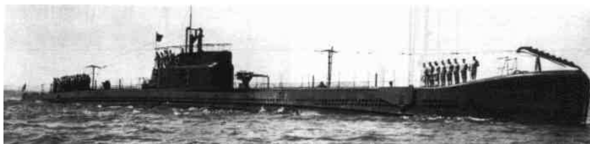
Il sommergibile Fratelli Bandiera in navigazione

Molti marinai, come me, non avevano nessuna esperienza di bordo e, spesso, le esercitazioni non raggiungevano risultati soddisfacenti, ma la guerra incalzava e bisognava andare a combattere comunque.