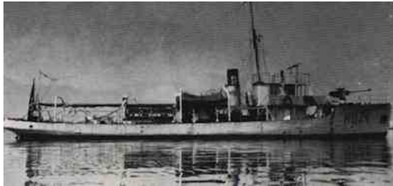
Dragamine RD 13

Tra il 1916 ed il 1929 la Regia Marina fece costruire circa 50 dragamine della classe RD (Rimorchiatore-Dragamine), progettati per appoggiare e soccorrere unità maggiori danneggiate e/o trovatesi in campi minati. A Castellammare di Stabia ne furono costruiti 25 appartenenti a diverse classi ( RD 1-2 ; RD 3-4-5-6- ; RD 15-16-17-18-19-20-21-22 ; RD 23-24-25-26 ; RD 31-32-33-34-35-36-37 ).