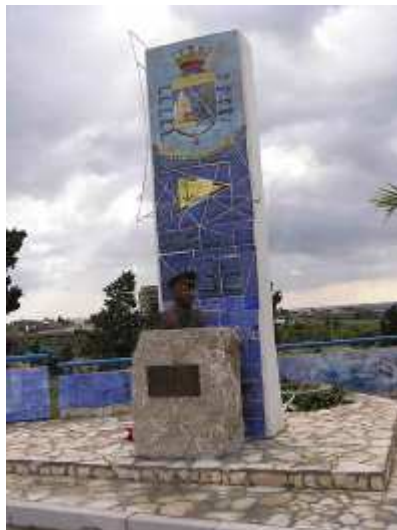
Monumento al Brig. Laganà

Nel 1972 il Presidente della Repubblica concesse al dragamine RD 36 la Medaglia d'oro al Valor Militare con la seguente motivazione:” Dragamine comandato ed armato da personale della Guardia di Finanza, agli ordini del Comandante della Flottiglia, attaccato nella notte del 20 gennaio 1943 da preponderanti forze navali nemiche, correva incontro all'avversario nell'eroico intento di coprire e salvare le tre unità della formazione, fino a trovarsi a portata delle proprie modestissime armi di bordo. Aperto il fuoco, cercava di arrecare al nemico la maggiore possibile offesa continuando a sparare, benché colpito più volte, fino a quando soccombeva nell'impari lotta, inabissandosi con il Comandante e l'intero equipaggio. Sublime esempio di indomabile spirito aggressivo, di sovraumana determinazione e di dedizione al dovere sino al supremo sacrificio”.