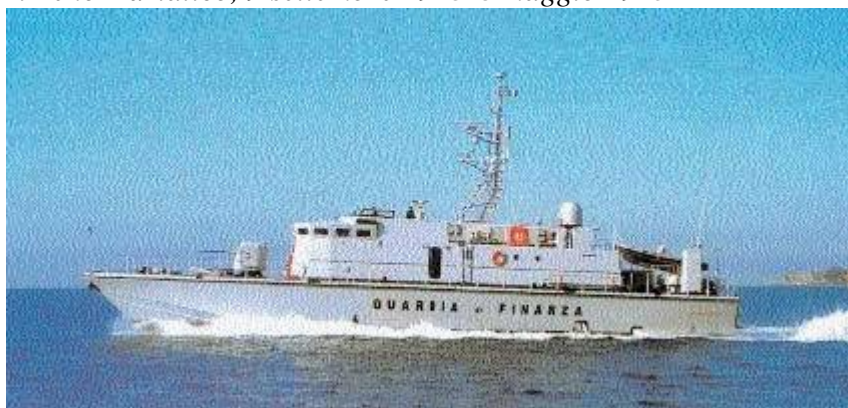
Guardacoste Operativo “G3 Di Bartolo” (2003)

Medaglia d'Argento per il naviglio della Guardia di Finanza concessa con D.P. del 29 luglio del 1949:” Nel corso di lungo ed aspro conflitto cooperava con la Marina Militare, con perfetta efficienza di uomini e di mezzi, nell'assolvimento del gravoso compito di vigilanza alle coste nazionali e di oltremare, di dragaggio alle rotte di sicurezza, di caccia ai sommergibili e di scorta ai convogli, contrastando sempre l'agguerrito avversario con valore, tenacia ed alto sentimento del dovere. Successivamente all'armistizio, tenendo fede alle leggi dell'onore militare, concentrava le superstiti unità e, pur menomato nei mezzi e negli uomini per le notevoli perdite subite, iniziava con rinnovato ardimento la lotta contro il tedesco aggressore. Perdeva complessivamente, nella dura lotta, il cinquanta per cento delle unità, contribuendo con eroici sacrifici singoli e collettivi, a mantenere in grande onore il prestigio delle armi italiane – Mediterraneo, 10 giugno 1940-8 settembre 1943. Tirreno-Adriatico, 9 settembre 1943-8 maggio 1945”