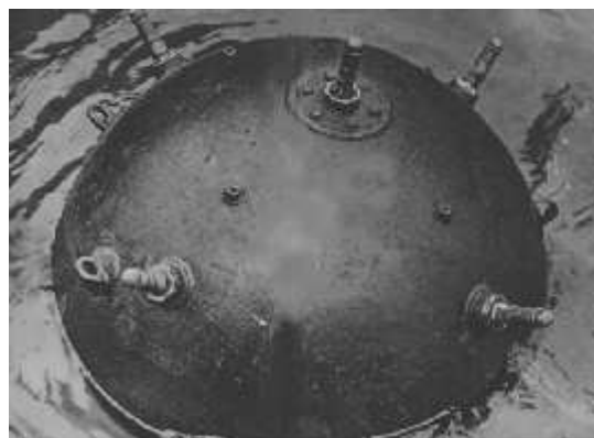
Particolari della mina

L'attività della piccola unità continuò incessante nelle acque di Licata, Trapani, Messina e Reggio Calabria