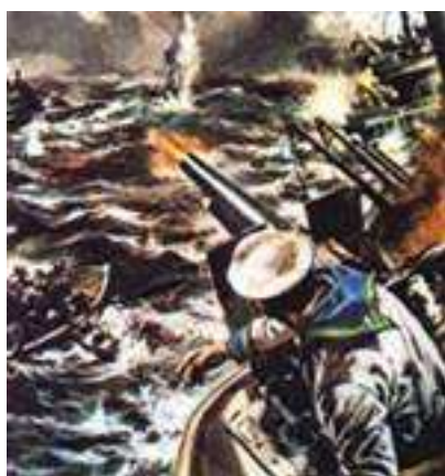
Finanzieri di mare in combattimento